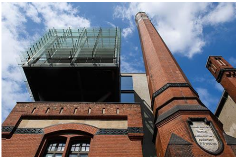
Radialsystem