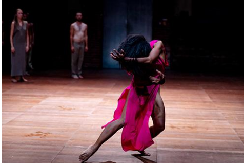
„Dialoge 2020 – Relevante Systeme“ – Sasha Waltz & Guests, August 2020

Neubaus. Das Haus kann als Veranstaltungsort für Konferenzen, Empfänge, Ausstellungen, Medienproduktionen, Preisverleihungen und Partys wie Galas gemietet werden. Großzügige Außenflächen zur Wasserseite laden zum Verweilen bei Sonnenuntergang ein, und im lichtdurchfluteten Foyer bietet die Cafébar ein Catering.