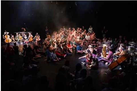
„#freebrahms“ – STEGREIF.orchester, Juli 2018